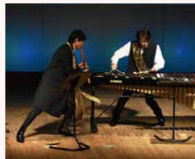
迫力のパフォーマンスに期待!!