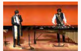
“世界最小オーケストラ”多彩な響き