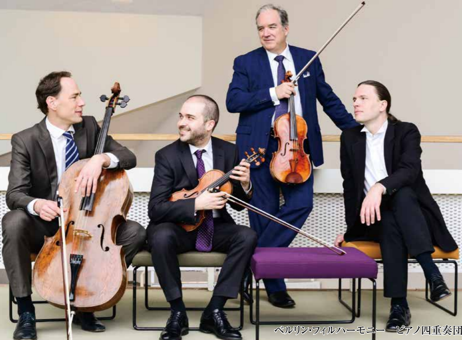
ペルリン・フィルハーモニー ピアノ四重奏団