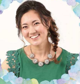
美郷 (パーカッション)