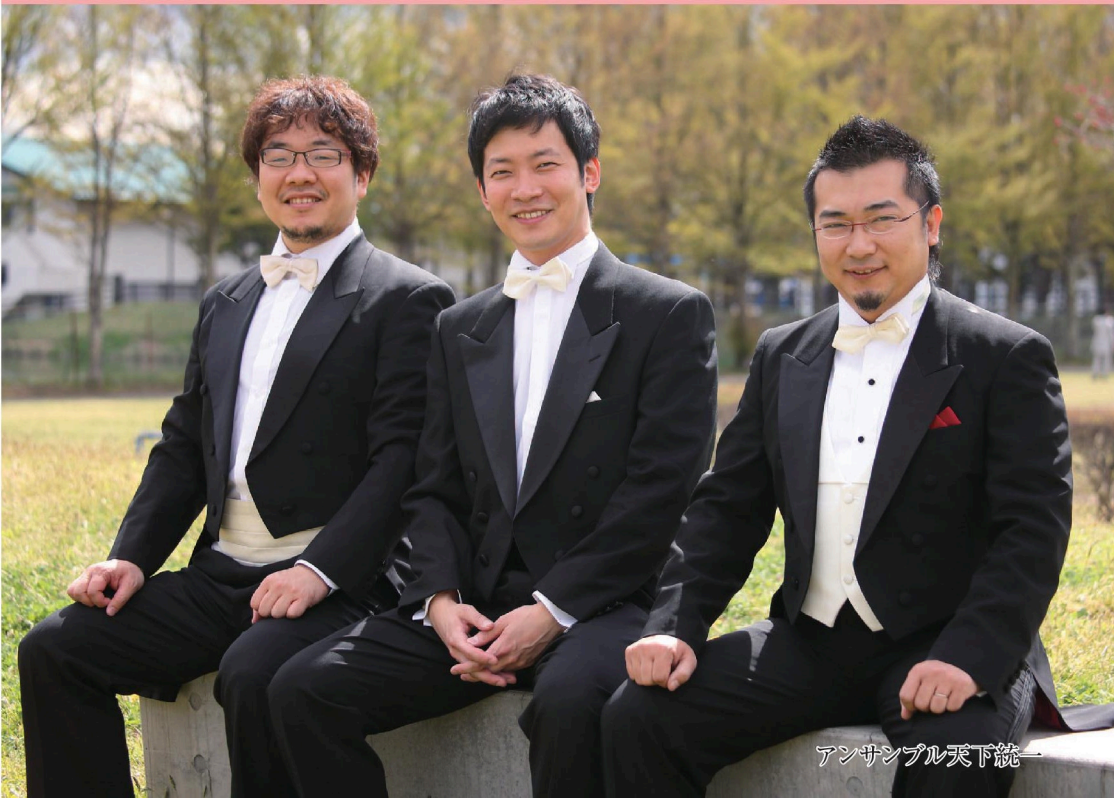
アンサンブル天下統一